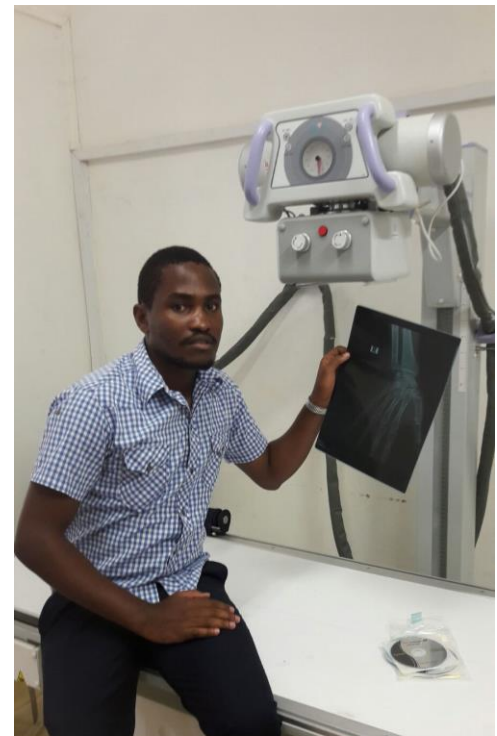
La nuova radiologia del St. Orsola Catholich Hospital