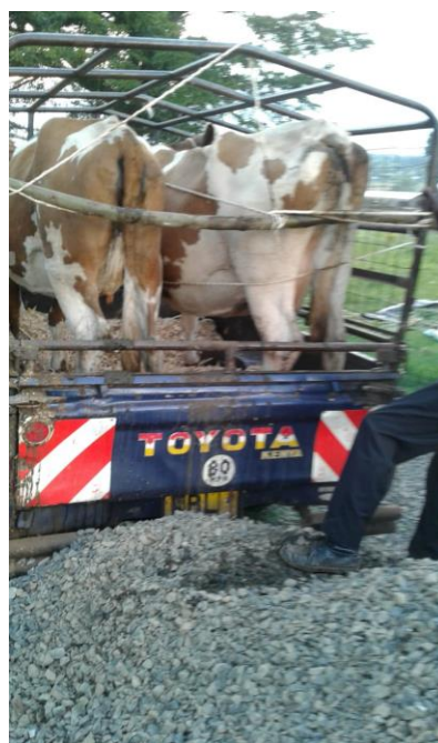
Acquisto delle prime mucche