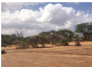
Siccità a Korr