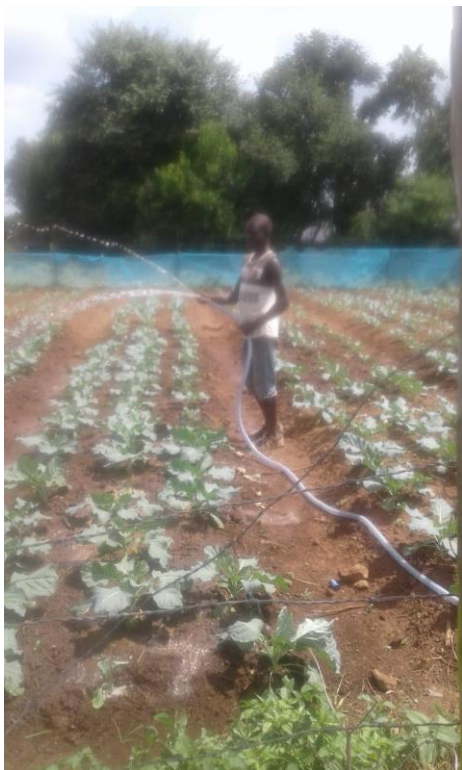
Coltivazione di cavoli

di Siaya – Kisumu nel corso del 2017 il grosso degli interventi edilizi è stato avviato solo a febbraio 2018, l'attività di coltivazione è già in corso e stanno per essere avviati i corsi di formazione per i farmers locali. L'associazione si sta attivando per garantire un quale supporto al progetto anche oltre la durata biennale prevista, sino al raggiungimento della piena autosufficienza