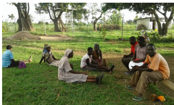
Meeting con i farmers