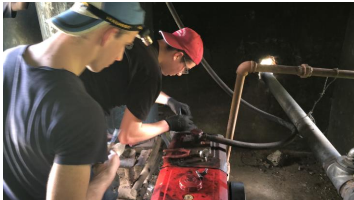
I ragazzi dell'ist. Sartor riparano la pompa per l'irrigazione