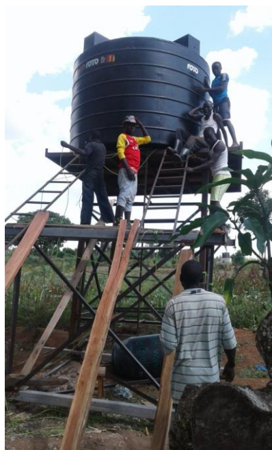
Montaggio di un tank di stoccaggio per l'acqua da potabilizzare